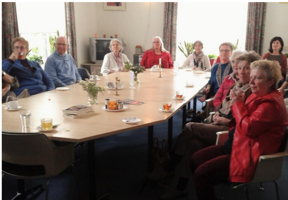
bezoekers tijdens een project activiteit